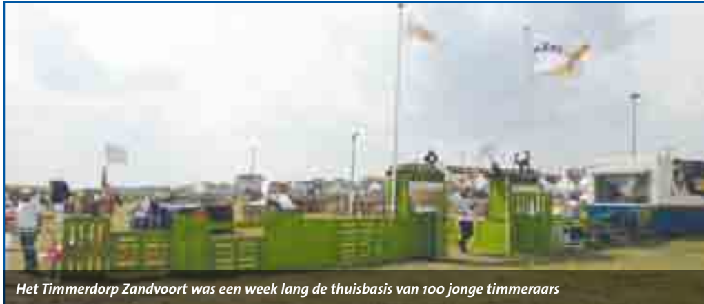
Het Timmerdorp Zandvoort was een week lang de thuisbasis van 100 jonge timmermeesters

Het Timmerdorp Zandvoort, dat vorige week aan honderd kinderen heel veel plezier heeft gebracht, is vrijdag officieel beëindigd en dat ging met een aantal feestelijke gebeurtenissen gepaard. Hoewel een groot aantal van de timmerlieden het huilen nader dan het lachen stond toen een bulldozer hun eigen hutten kwam opruimen, konden ze toch blij vooruitkijken want op het programma stonden nog een barbecue en later op de avond een feestvuur van alle gebruikte pallets.